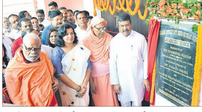
ନୂତନ ଶିକ୍ଷାଦାନ ସୌଧ ଲୋକାର୍ପଣ ଅବସରରେ କେନ୍ଦ୍ରମନ୍ତ୍ରୀ ଧର୍ମେନ୍ଦ୍ର ପ୍ରଧାନ ଓ ଅନ୍ୟମାନେ।

ଭୁବନେଶ୍ୱର, ୬।୯ (ବ୍ୟୁରୋ) ରାଜ୍ୟର ୨୫ ଜିଲ୍ଲାରେ ନବଜାତ ଶିଶୁଙ୍କୁ ଡାକ୍ତରୀ ଦେଖାଯାଇଛି। ପିଲାଙ୍କ ବୟସାବୁଦ୍ଧିରେ ଉଚ୍ଚତା ଏବଂ ଓଜନ କମ୍ ହେବା ଏକ ଚିନ୍ତାଜନକ ବିଷୟ ହୋଇଛି।