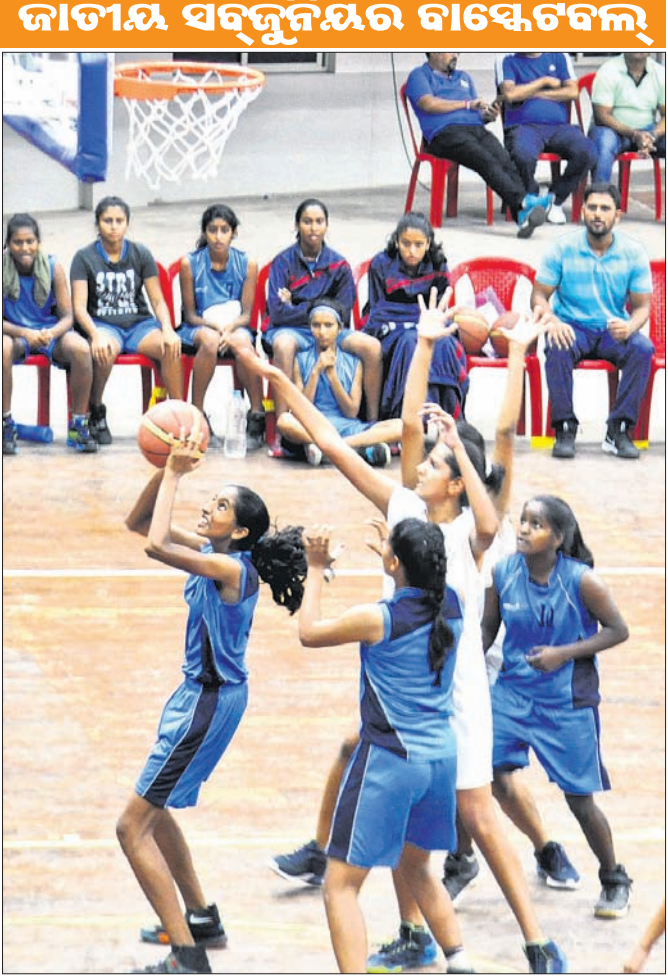
ଦିଲ୍ଲୀ ଓ ଉତ୍ତର ପ୍ରଦେଶ ମଧ୍ୟରେ ଅନୁଷ୍ଠିତ ବାଳିକା ବିଭାଗ ମ୍ୟାଚ୍।

କଟକରେ ଚାଲିଥିବା ୪୬ତମ ଜାତୀୟ ସର୍ବଜନିୟର ବାସ୍କେଟବଲ ଚାମ୍ପିୟନଶିପରୁ ଓଡ଼ିଶା ବାଳକ ଦଳ ବାଦ ପଡ଼ିଛି। ଶୁକ୍ରବାର ଅନୁଷ୍ଠିତ ଲୋୟର ପୁଲର କ୍ୱାର୍ଟର ଫାଇନାଲ ମ୍ୟାଚ୍‌ରେ ବାଳକ ଦଳ ମଣିପୁରଠାରୁ ପରାସ୍ତ ହୋଇଛି। ଅନ୍ୟପକ୍ଷରେ ବାଳିକା ବର୍ଗର ଲୋୟରପୁଲ କ୍ୱାର୍ଟର ଫାଇନାଲରେ ଓଡ଼ିଶା ୩୨-୩୧ ପଏଣ୍ଟରେ ଆକ୍ରମଣକୁ ହରାଇ ସେମିଫାଇନାଲରେ ପ୍ରବେଶ କରିଛି।