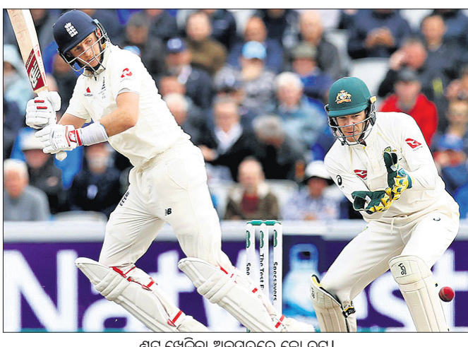
ଶର୍ବ୍ ଖେଳିବା ଅବସରରେ କୋ ରୁଟ୍।

ମାଞ୍ଚେଷ୍ଟର, ୨୮ - ସ୍ଥାନୀୟ ଓଲ୍‌ଗ୍ରାଫର୍ ଗ୍ରାଉଣ୍ଡରେ ଚାଲିଥିବା ଅଷ୍ଟ୍ରେଲିଆ ବିପକ୍ଷ ଚତୁର୍ଥ ଆଣ୍ଡରଡ଼ ଟେଷ୍ଟ ମ୍ୟାଚ୍‌ରେ ଘରୋଇ ଇଂଲଣ୍ଡ ସଂପର୍କ ଛାଡ଼ି ରଖିଛି। ଟ୍ରେଜି ଅଷ୍ଟ୍ରେଲିଆ ପ୍ରଥମ ଇନିଂସରେ ଅଭିଜ୍ଞ ବ୍ୟାଟ୍ମ୍ୟାନ ଷ୍ଟିଭ୍ ବ୍ଲିଥ୍‌ଙ୍କ ୨୧୧ ରନର ଦ୍ୱିଶତକୀୟ ପାଲି ସହ ୧୨୭ ଓଭରରେ ୮ ରଜକେଟ ହରାଇ ୪୯୭ ରନ ସଂଗ୍ରହ କରି ଇନିଂସ ଯୋଷଣା କରିଥିଲା।